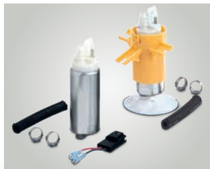
Falls erforderlich liegen den Ersatzteilkits die benötigten Hilfsmittel bei.